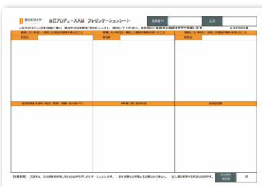
自己プロデュース入試 プレゼンテーションシート

シラバスや研究室訪問、先輩訪問のほか、自分で集めた情報をもとに、4年間の大学生活をプロデュースし、A3のシートにまとめます。A3という限られたスペースに、いかに情報を整理して配置するかが重要なポイントです。