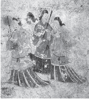
高松塚古墳西壁女性群像