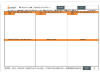
自己プロデュース入試 プレゼンテーションシート

シラバスや研究室訪問、先輩訪問のほか、自分で集めた情報をもとに、4年間の大学生活をプロデュースし、A3のシートにまとめます。A3という限られたスペースに、いかに情報を整理して配置するかが重要なポイントです。